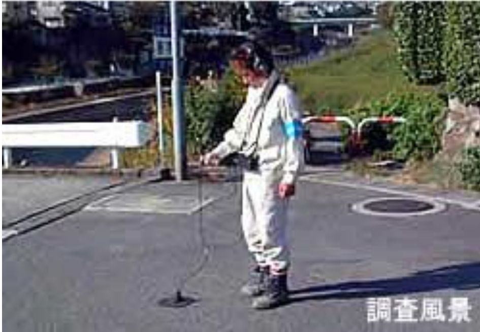
写真. 路上にて探知機を用いた配管の現況調査状況(他都市での事例)