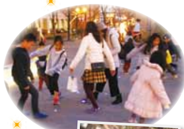
点滅ライトに合わせて、戯れる子どもたち

変化にとんだランドスケープそのものが創り出す様々な陰影、それが六甲アイランドリバーモールの奏でる「あかりの交響詩」です。(照明デザイナー 長町志穂(株式会社 LEM 空間工房 代表取締役))