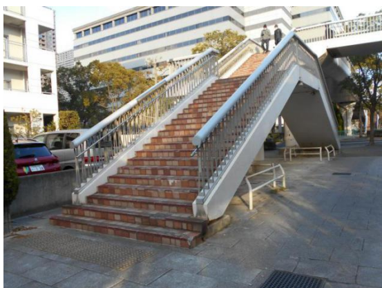
②この歩道橋下に設置されていた(左は W6 街区)