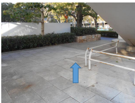
②ベンチが撤去された跡(矢印)