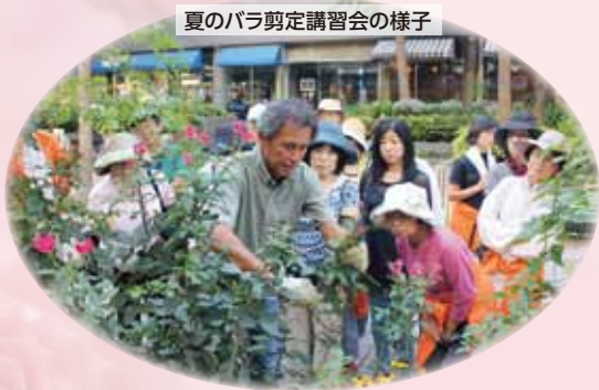
夏のバラ剪定講習会の様子

補植作業は11月9日(水)10時から予定、ローズガーデンファミリーで行います。ガーデニングに興味がある方は、ぜひお気軽に補植作業にご参加ください。ローズガーデンファミリーは、みなさんのお越しをお待ちしています。