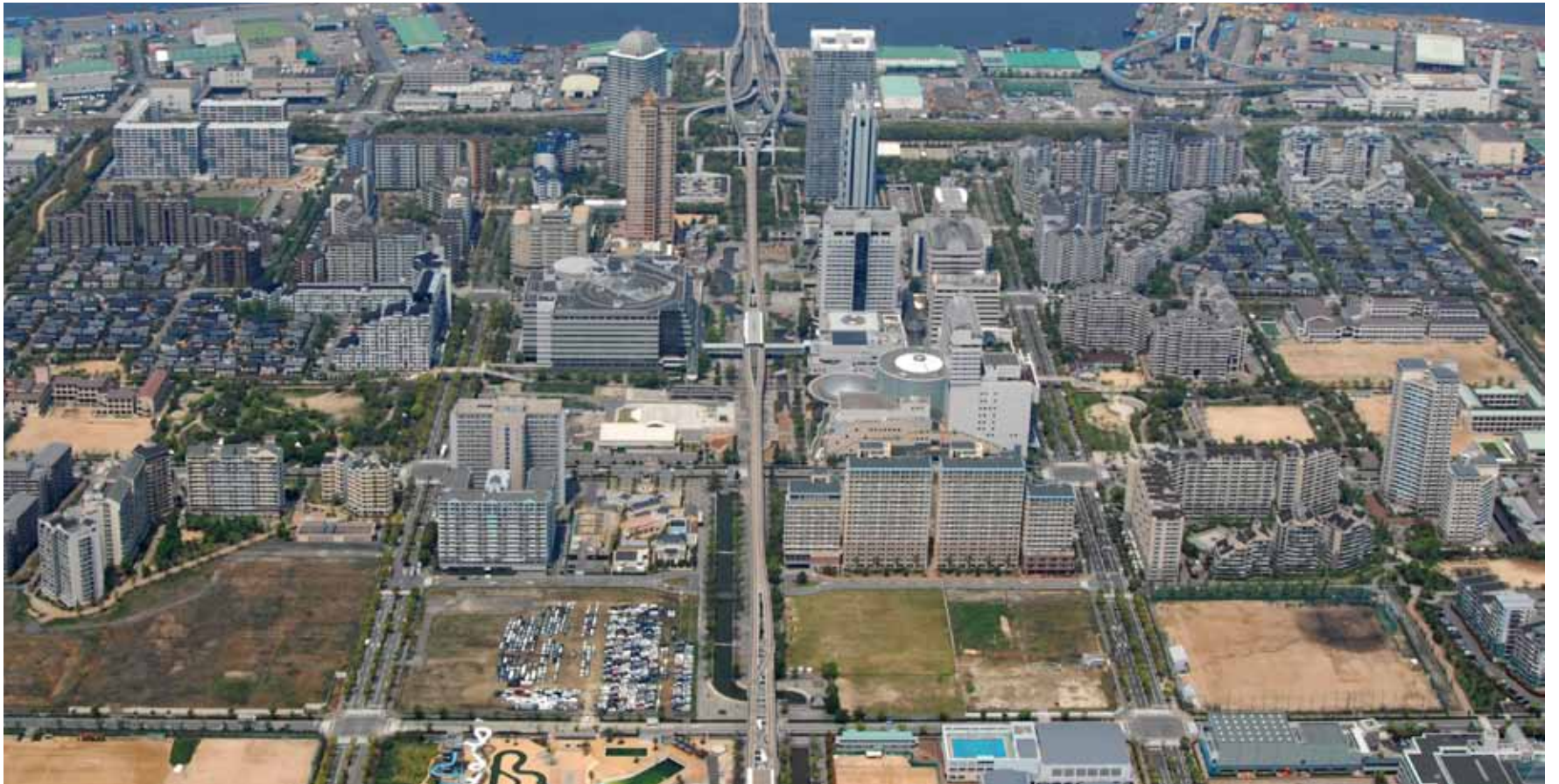
「中心部に空き地が目立つ六甲アイランドの現況」